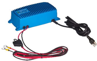
Blue Smart IP67 acculader 12/25