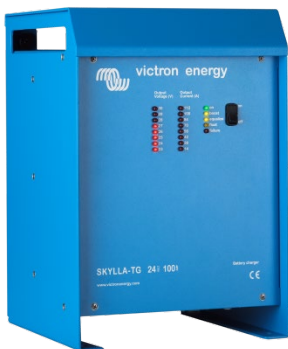
Skylla TG 24 100