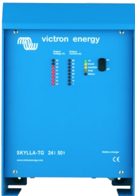
Skylla TG 24 50