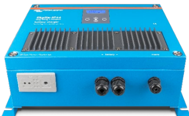
Skylla-IP44 12/60 (1+1)

Om meer te weten te komen over accu's en het opladen van accu's zie ons boek 'Altijd stroom' (gratis verkrijgbaar bij Victron Energy en te downloaden op www.victronenergy.com ).