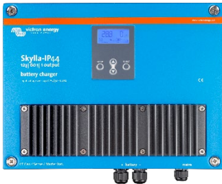
Skylla-IP44 12/60 (1+1)

12 V/60 A en 24 V/30 A, ingangsspanningsbereik 90-265 V