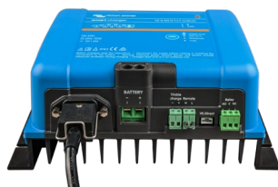
Smart IP43-acculader 12/50 (1 + 1)