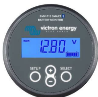
Bluetooth bespeuren: BMV-712 Smart-accu monitor