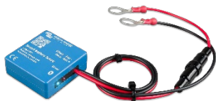
Bluetooth bespeuren: Smart Battery Sense