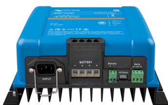
Smart IP43-acculader 12/50 (3)